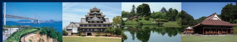
Great Seto Bridge Okayama Castle Okayama Korakuen Garden Shizutani-school