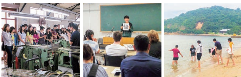
"Study of Japan" class