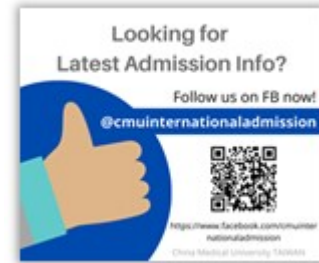
CMU International Admissions FB