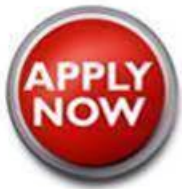
Online Application System