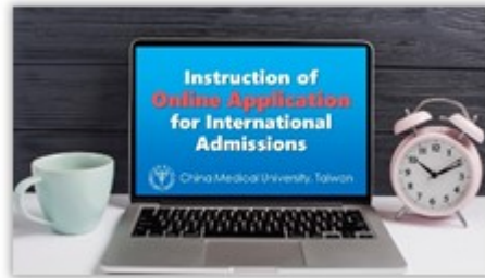
Instruction for Online Application