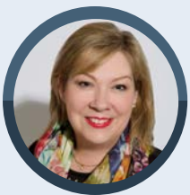
Senior Lecturer Education Focused Academic

School of Management University of New South Wales