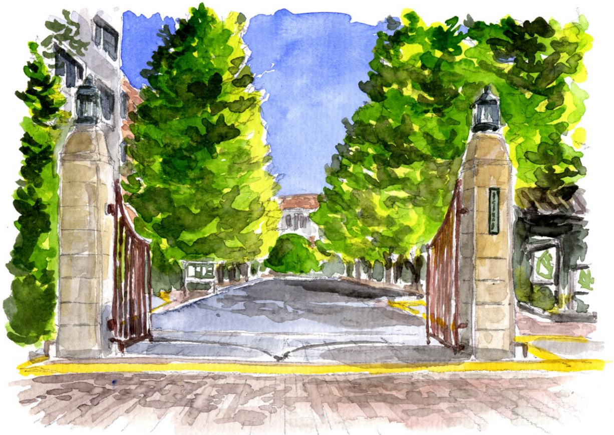
Main gate of Ochanomizu University illustrated by Mr. Chihiro Tanaka

*Please note that 2020 Ocha Summer program was originally scheduled in June 2020 but is now postponed to February 2021 due to the influences of COVID-19. Thank you for your understanding in advance. The updates on this brochure are clarified with “New!” icons.